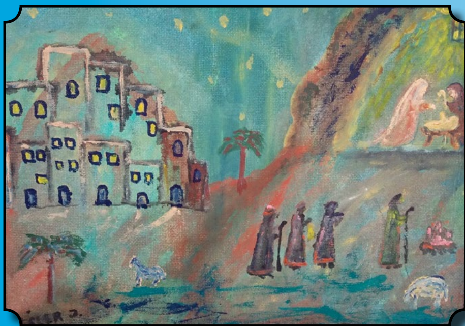
Zapisal: Jože Tišler, Prleška krhlenka

Ne svečnico smo nesli sveče k žegni – blagoslovu pri sv. maši. Dopoldan ali dan prej so običajno prišle tri ženske, ki so zraven nosile Marijo ... jo položile v hiši na mizo, poklekile ter zapele o »Mariji Svečenski«. Tudi tem pevkam se je dalo nekaj denarja. Potem pa smo lahko pospravili smreko in jaslice za naslednje leto. S tem smo zaključili praznovanje božičnega časa.